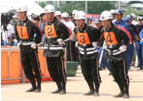
▲昨年8月の熊本県消防操法大会で優勝した小型ポンプ車の部の競技。荒尾市消防団の選抜メンバーで臨んだ。

平成17年3月 福岡県西方沖を震源とする地震（震度4を記録。昭和以降では市内最大の地震）