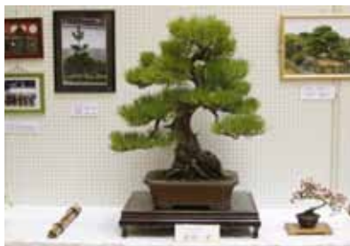
▲昨年11月の小岱松盆栽展