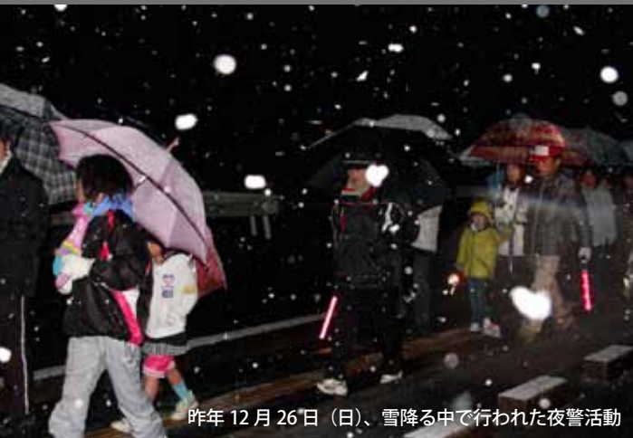
昨年12月26日(日)、雪降る中で行われた夜警活動