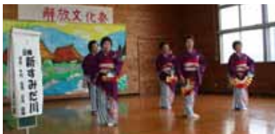
▲昨年の解放文化祭