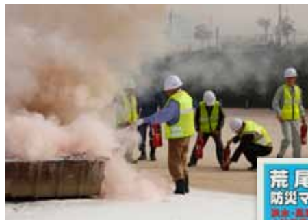
▲ 荒尾市総合防災訓練。毎年関係機関や地域住民の皆さんと実施している。 ▼ 荒尾市防災マップ。市で定めている避難所や避難経路などを掲載。

2 前項に規定するもののほか、地方公共団体の住民は、自ら災害に備えるための手段を講ずるとともに、自発的な防災活動に参加する等防災に寄与するように努めなければならない。