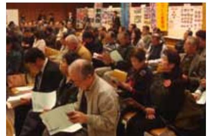
▲昨年の元気づくり交流会