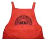
荒尾市 食生活改善 推進員協議会

時間もかからず、野菜も一緒に食べられる、一石二鳥な一品です。お魚と野菜のうまみがギュッと詰まっています。 季節ごとに旬の野菜を使えばバリエーションも豊富です。 フライパンに水を張って蒸し焼きにしてもおいしくできます。今日の主菜はこれで決まり！