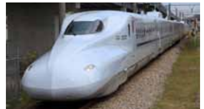
▲九州新幹線「さくら」