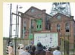
荒尾市感幸のまちづくり推進協議会 荒尾市産業振興課観光推進室 荒尾市観光協会

皆様に、荒尾の魅力をたっぷり体感いただくプログラムの数々、多くの方々のご参加をお待ちしております。