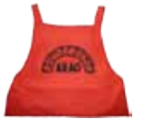
荒尾市 食生活改善推進員 協議会

「だし」は目に見えないけれど「おいしさのもと」が溶け込んでいます。今回の治部煮は「だし」のうまみを体の芯から感じられる一品です。