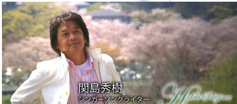
関島秀樹 シンガーソングライター