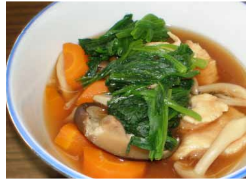
じぶに 治部煮 ~だしを味わう~