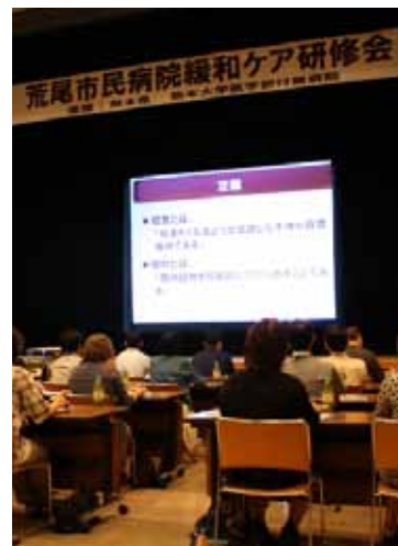
▲熊本県内の緩和医療に携わる医師や医療スタッフを対象にした「荒尾市民病院緩和ケア研修会」を開催

※報告書の詳しい内容は、ホームページに掲載しています。 ホームページアドレス http://www.city.arao.lg.jp