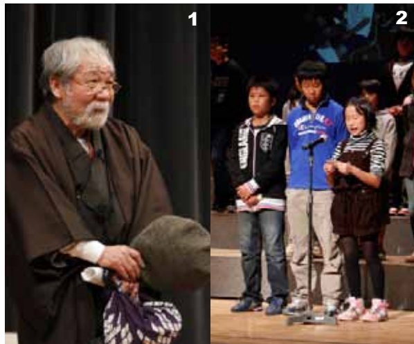
1 講師の常田富士男さん。優しい語り口に参加者もうっとり。2 有明小学校の児童による意見発表

12月4日(土)、文化センターで'10荒尾市人権フェスティバルが開催されました。 10回目を迎えた今回の人権フェスティバルでは、桜ゆりかご会と手話ダンスひびきによるアトラクション、荒尾第三小学校、有明小学校、荒尾高校の児童・生徒による意見発表、俳優の常田富士男さんの朗読を交えた講演、ギャラリィなどでの人権についての作品展が行われました。 発表者や出品者が日常で感じている人権意識に触れることで、改めて自らを振り返り、人権について考える一日となりました。