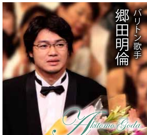
郷田明倫 バリトン歌手

入場料 ● 一般 2,500円 ペア 4,500円 (当日券は一般3,000円、ペア券は前売のみ)