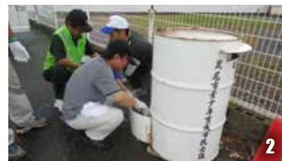
2 環境浄化パトロールとして、白ポスト点検や有害図書の回収も行われます