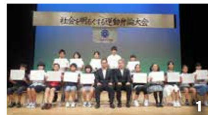
1 弁論大会。小・中・高・支援学校生が「社会を明るくする」をテーマに発表します