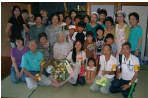
▲ 助丸区の皆さんと忽那さんの記念写真

また、主人公役の忽那汐里さんは、助丸区の皆さんから贈られた花束に驚き、とても喜んでいました。