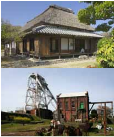
◀ 荒尾の宝 ④高崎兄弟の生家 ⑦万田坑施設

「生まれ育ったふるさとを応援したい、自分と関わりが深い地域に貢献したい」という人が、その自治体に寄付した場合に、個人住民税・所得税が一定額まで控除される「ふるさと納税制度」が平成20年5月に創設されて以来、これまで（平成22年10月末現在） 341万 円（39件）の寄付をいただいています。荒尾市では、お寄せいただいた寄付金を「荒尾市ふるさと応援寄附金」として、本市の活性化のため、寄付者が指定した事業に活用します。ぜひ、市外のご家族、お知り合いの皆さんにPRしていただきますようお願いいたします。