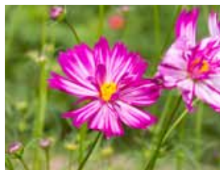
▲荒尾こすもすの里にて。変わった品種もきれいでした(10/15撮影)