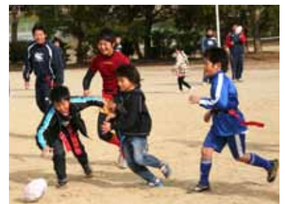
▲昨年度のタグラグビーの様子。荒尾高校 生と一緒に、たのしくタグラグビー体験!