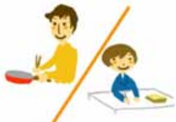
個人として、自分らしさと能力が発揮できる社会こそ「男女共同参画社会」です