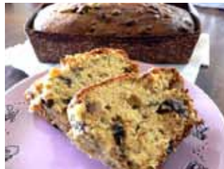
パンなどの食品製造

毎月第2水曜 ガレージセール。その他随時注文を受付 ☎62・1175（荒尾1694番地1／海陽中学校前）