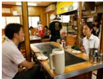
▲ お好み焼屋で熱演