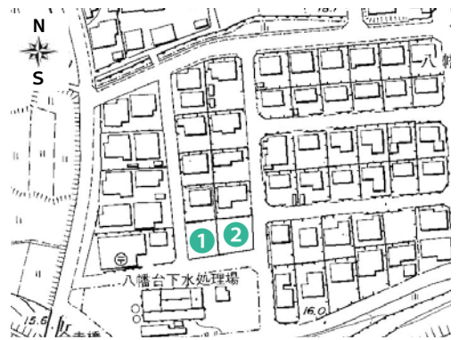
八幡台団地宅地分譲位置図