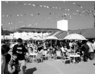
▲ 昨年の秋の感謝祭の様子