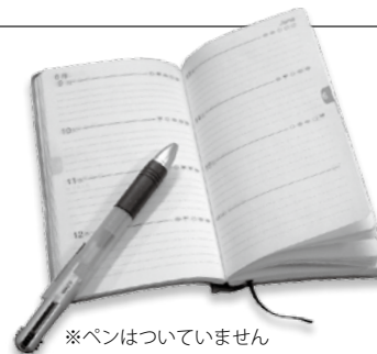
※ペンがついていません

②資料・名簿編…荒尾市行政構図、市議会議員名簿、市役所電話番号簿、納税ごよみ、市民課窓口事務のご案内、保健予防事業のご案内、指定文化財一覧表、市内官公庁等連絡先一覧表、市町村勢一覧、県選出国會議員名簿、市町村別人口・面積、中央官庁・県内主要官庁・県の機関、東京・大阪・福岡地下鉄路線図、年号・西暦・年齢早見表など。