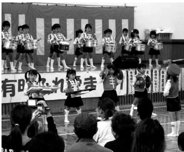
◀あけぼの幼稚園児による鼓隊。軽快なリズムで観客を楽しませた。

10月24日(日)、有明小学校体育館で、有明ふれ愛まつり(有明元気づくり主催)が開催されました。一人暮らしの高齢者を招待し、多くの住民がふれ合える祭りを目的として開催されています。10月15日に開催された「のぼらさん」で奉納された節頭行事から始まり、あけぼの幼稚園の園児によるダンスや鼓隊、有明小学校の児童によるよさこい、校区住民の皆さんによる踊りやコーラスなどが披露され会場を盛り上げました。あいにくの雨の中でしたが、多くの参加者で賑わいました。