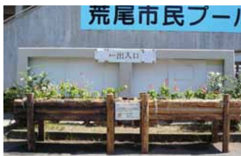
◀ 市民プール入口に設置された立ち上がり花壇。約10基が新設され、訪れる人の目と心を和ませた。

県民体育祭に合わせ、各地から来荒する選手や関係者の皆さんに心温まる歓迎の意を込めて、陸上競技場、市民プール、文化センターに立ち上がり花壇を設置しました。この花壇は熊本県建設業協会荒尾支部やエコパートナーあらお市民会議の協力のもと設置されました。また、今大会は各会場を花でいっぱいにして飾っていただいた花いっぱい推進協議会、運営に携わっていただいた市体育指導委員協議会、地元競技団体、ボランティアの皆さんの多大な協力で、無事に終えることができました。