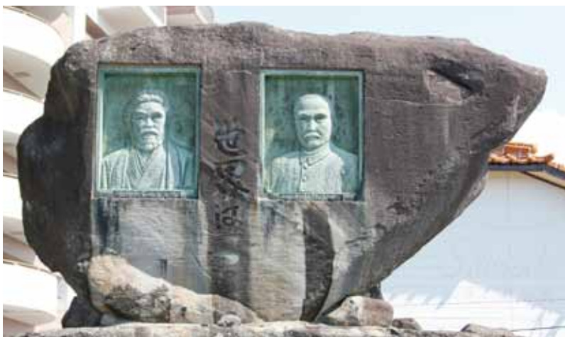
▶ 昭和40年に建立された「孫文、滔天両先生先覚回天記念像」。運動公園東側駐車場の一角にある。孫文（右）と滔天（左）のレリーフの間には「世界は一つ」の文字が刻まれている。

彼が示したこれらの一貫した姿勢は、孫文以外の中国人革命家にも畏敬された点であった。