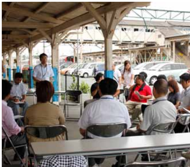
▶荒尾駅と駅周辺の活性化は、荒尾市の大切な課題。より人が集まる駅と駅周辺をめざして協議。

花壇整備など景観面からの意見や、観光に力を入れる提案、更に駅を中心とした活性化案など豊富なアイデアが披露され、荒尾駅が「まちの顔」として新たに生まれ変わるため積極的な意見交換が行われました。