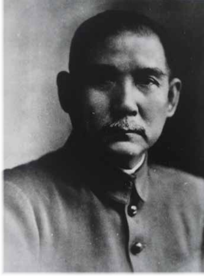
▲ 孫文 (1866年 -1925年)

1911年——今から99年前に起こった中国の民主化革命である「辛亥革命」は、現在の日本に住む私たちにとって、なじみが薄いものであるように感じる人もいのではないだろうか。