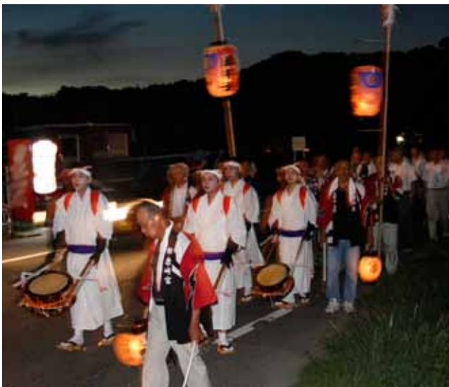
▶上井手上の太鼓若衆の様子。残暑の夕暮れを、雅に練り歩く。

神社の階段には約100個の行燈が足元を照らし、幻想的な空間を演出します。境内では竹灯籠・ねずみ火という仕掛け花火が拝殿に吊るされた提灯に向かって放たれました。また、松札の販売や抽選会が行われるなど参加者を楽しませました。