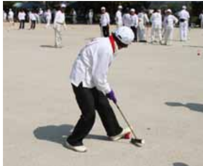
▲ 見事地元優勝を勝ち取ったゲートボール女子。おめでとうございます。