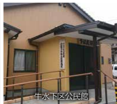
地域と行政のパイプ役 行政協力員 新任紹介 4月1日付けで新たに次

高齢者の生きがいづくりを応援するため、公民館のバリアフリー化を進め、介護予防拠点である「通いの場」づくりを行っています。介護予防体操、いきいきサロンや高齢者見守りなどの介護予防活動を行っています。ぜひご利用ください。 ●平成28年度整備介護予防拠点 万田東区公民館、川登公民館、南増永区公民館、牛水下区公民館、牛水上区公民館 園高齢者支援課介護保険係 ☎ 63・1418