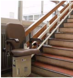
↓市民課窓口前に設置された昇降機