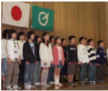
↓四小の歴史を発表する在校生たち