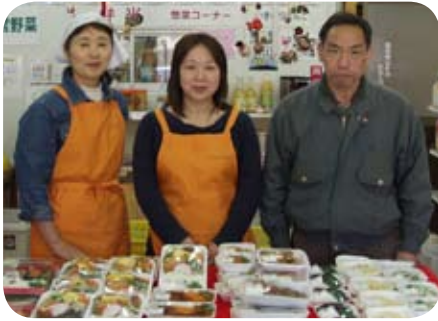
私たちが運営しています!

荒尾市内には地域再生事業の一環として、産直野菜販売所（青研・ありあけの里・にんじん畑）がオープンしています。今回で最後の紹介です。行ってみなっせ!