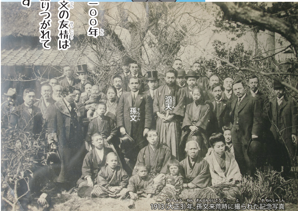
1913(大正3)年、孫文来荒時に撮られた記念写真