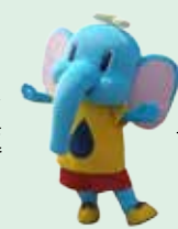
市企業局マスコットキャラクター「あらかくん」

※アンケート調査票は、なるべくご家庭の水道使用状況が分かる人がご記入ください。 ※アンケートには「共通」、「水道」、「下水道」の3種類を同封しています。 ※アンケート調査票は郵送しますので同封の封筒でご返信ください。