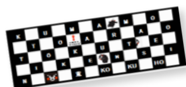
▲くまモンタオル(見本)