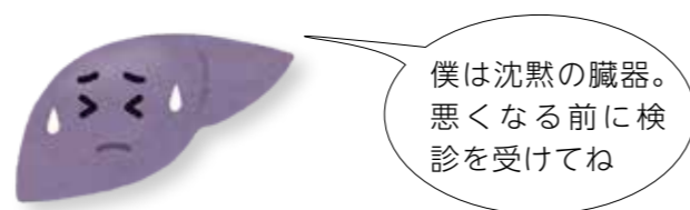
▲不健康な肝臓くん

ウイルス性肝炎は肝臓が肝炎ウイルスに感染し、肝臓の細胞に炎症が起こることによって肝細胞が壊される病気です。日本では肝炎ウイルスに感染している人が多く、肝臓がんによる死亡原因の実に約90%がB型あるいはC型肝炎ウイルスの感染によるものです。下図を見ると、全国的にみても、熊本県は肝臓がんでの死亡率が高くなっており、人口10万人当たりの死亡率はワースト7位になっています。ただ、治療法も進歩してきたこともあり、早期発見であれば、C型肝炎は約80%の人が完