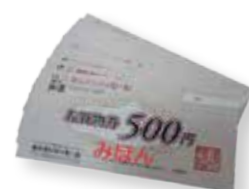
▲あらおシティモール商品券(見本)