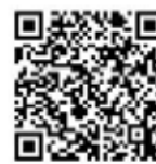
▲上のQRコードを読み取ってください

次のような問題が発生することがあります。 ①相続が争いの元になる。 ②相続登記をしていない間にさらに相続が発生すると、相続人の調査に時間がかかり、費用が高額となる。所在不明の人がいた場合などは、手続きが極めて困難となります。