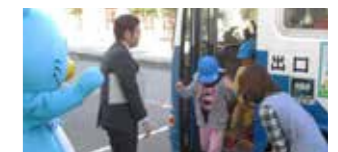
▲カンガルー保育園での出張教室