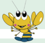
荒尾市マスコットキャラクター「マジッキー」