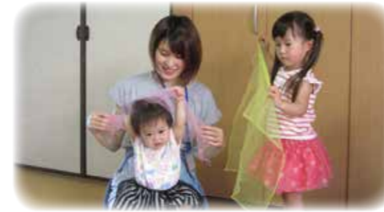
▲ファミリー・サポート・センター会員の活動の様子

ファミリー・サポート・センターでは、子育てを応援したい人と子育てを応援してほしい人が、それぞれ会員登録し、子育て支援を行っています。