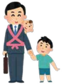
☎子育て支援課給付相談係 ☎63-1417