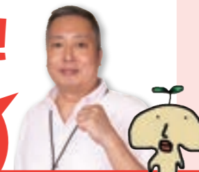
協力隊 ゆるキャラ「ナシエル」