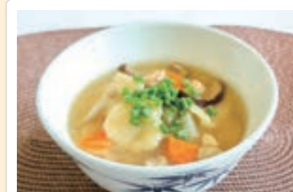
~あなたはしょうゆ派? みそ派?~ 郷土料理 だご汁