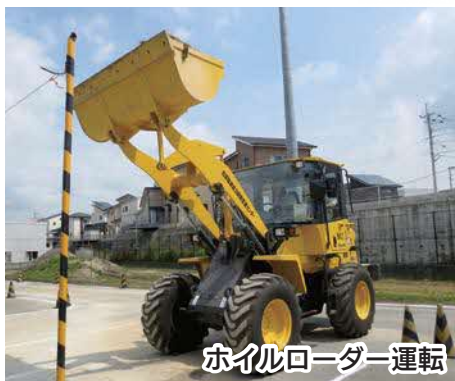
ホイールローダー運転