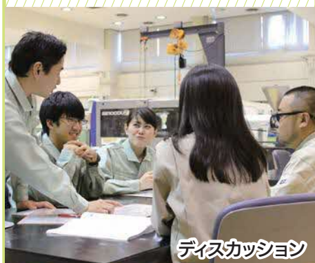
ディスカッション