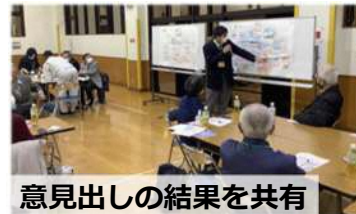
意見出しの結果を共有