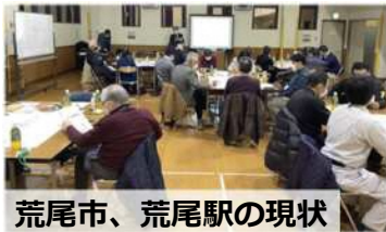
荒尾市、荒尾駅の現状