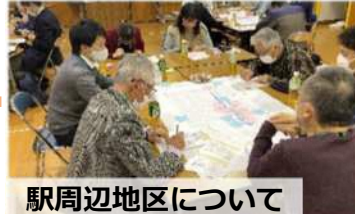
駅周辺地区について