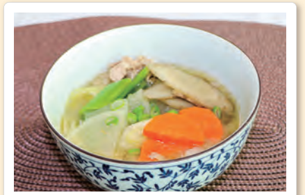
～野菜のうま味がおいしい～ 豚汁