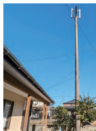
放送スピーカー(牛水上)