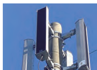
放送スピーカー(高浜)