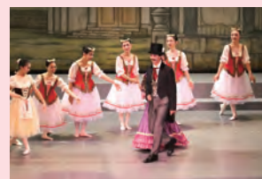
浅田市長も物語の「市長役」として出演しました。