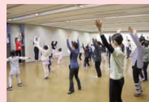
未経験者も年齢関係なく、バレエに挑戦できました。