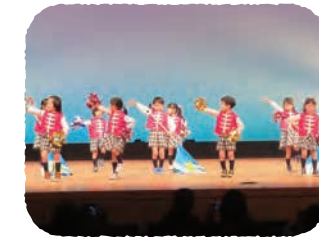
荒尾四ツ山幼稚園