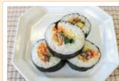
~食卓にぎやかに~ 韓国風のり巻き「キンパ」