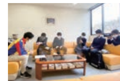
▲岱志高生の取材の様子

岱志高校の生徒が地域の魅力を発信するプロジェクトに取り組んでいるのをご存知ですか? 若者目線で「これいいな」「多くの人に伝えたい」と感じた荒尾関連の事柄を、生徒たちが15分のラジオ番組用に取材しています。私も現場に立ち会ったり、取材を受けたりしました。出来上がった番組は、コミュニティラジオ「FMたんと(79.3MHz)」で放送中(毎月第三木曜19時~)。市内の高校生は今どんなことに興味を持ち、どんな質問を大人にぶつけているのでしょうか。フレッシュな感性そのままの15分、一度聞いてみてください。