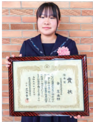
熊本県納税貯蓄組合連合会 優秀賞