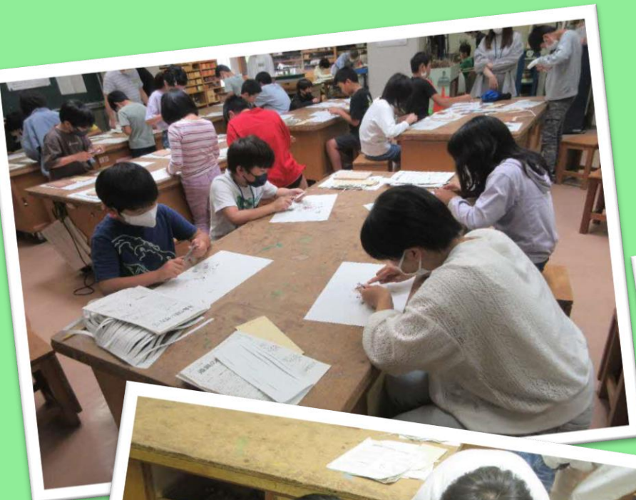
鉛筆削りの練習 先生のお手本をよく見て