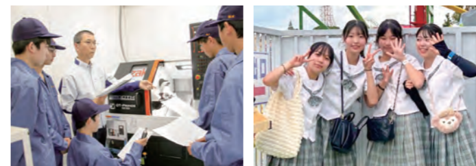
最新機器を取り入れた機械科の実習 新入生歓迎行事はグリーンランドで!