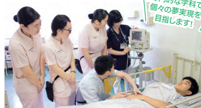
実際の医療現場での実習