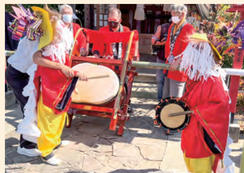
令和4年度の孤屋地区