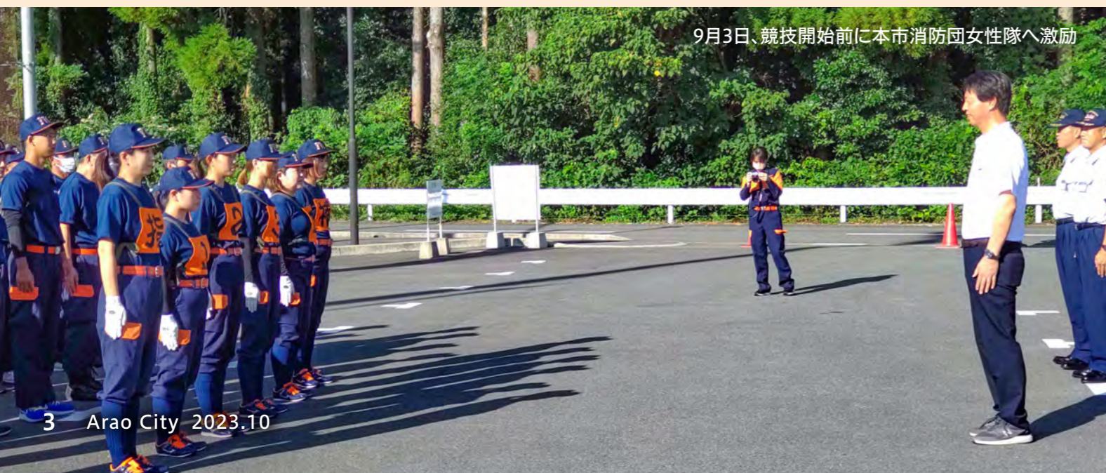
9月3日、競技開始前に本市消防団女性隊へ激励

これらの取り組みについては、今月後半に市内4か所で開催する「市長と語ろう!! 住民懇談会」(広報あらお9月号裏表紙参照)でもご報告し、皆さまの声を直接お聴きすることで、市民の幸せや市の発展につなげていきたいと考えていますので、多数のご参加をお待ちしております。