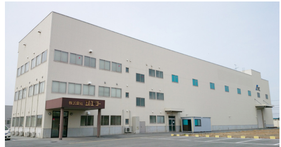
▲ 2011年、荒尾に設立された九州営業所