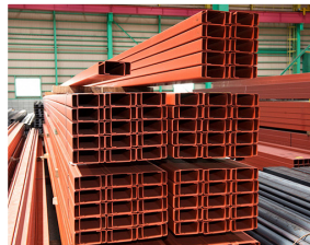
▲鋼材：1本から多品種 大量発注まで対応可能

【わが社のここがイチ押し！】 現場環境をより効率的に快適に あらゆるニーズを実現する窓口