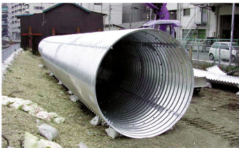
▲土木建材：鉄筋ワイヤーメッシュをはじめ幅広く扱い、現場への直接搬送も行っています