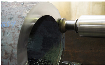
▲非鉄金属特殊鋼：汎用性の高いステンレス鋼、アルミ材からチタンや銅まで取り扱います

構造物は刻々と進化を遂げ、鋼材・建材のオーダーも多様化。同時に加工や発注、納入確認など現場責任者の手間も増大しています。そこで当社は、現場の負担を軽くするため多くの加工メーカーとの協力体制を確立。手配・加工・納入まで手厚いサポート体制を整えています。