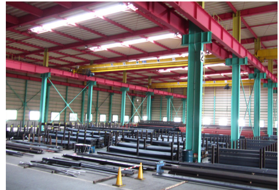
▲在庫は数量・種類ともに豊富な品ぞろえ。突然のオーダーにもお応えできるよう常に準備万端です