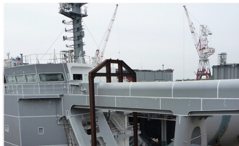
▲造船プラント：ジンクコート材、ステンレス、鋼管など在庫多数。即納対応でサポート