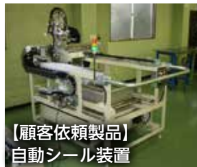
【顧客依頼製品】 自動シール装置

◀ 1 台のコントローラーで、同時に最大 64 軸の制御が可能です。従来の 1 台 1 工程の単体ロボットを自由に連結できるマルチロボットシステムです。