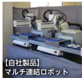
【自社製品】 マルチ連結ロボット

さらに、九州工場と本社との連携を目的に、スタッフの行き来を行っており、相互の技術の向上を図っています。