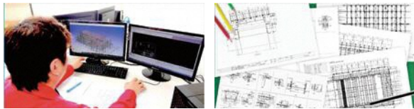
↑鉄骨用CADソフト、汎用CADソフトによりさまざまなニーズに対応

建設現場では、柱の長さからボルトのサイズ、穴の位置まで計算された緻密な「ばらし図」が重要です。図面は、一般建築物のみならず立体駐車場などの特殊建築物に至るまで全国に展開しています。