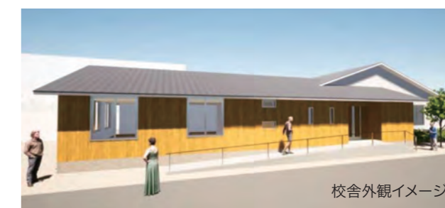
校舎外観イメージ