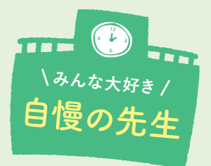
にしかわ たかお 西川 孝雄先生