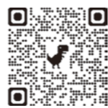
▲ボランティア申し込み