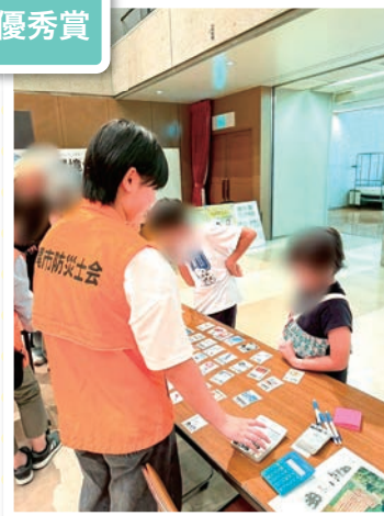
荒尾市最年少防災士 親子防災士