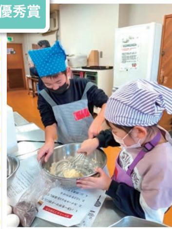
クッキング クッキング☆キッズ