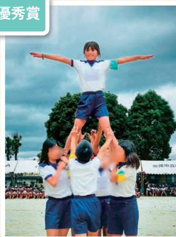
私の輝く一番星 ペイコ