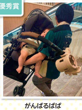
がんばるばば ばなな