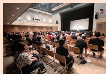
映画「女優は泣かない」上映イベント