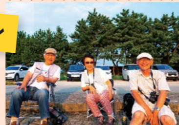
幅広い年齢層が来場