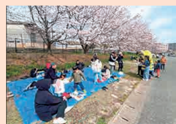
お花見ピクニック

「ヒガステ」の愛称で月に1度開催される定期イベント(雨天中止・12月～2月は休み)。日本最大の規模を誇る荒尾干潟にDJブースを設置し、夕暮れの干潟の景色と音楽を楽しむ空間づくりをしています。