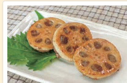
～ 噛む回数アップで健康に～ 照り焼きれんこんハンバーグ