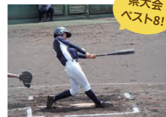
三中と合同チームで県大会出場!