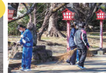
野原神社清掃活動