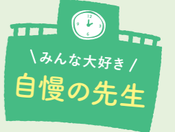
しょうだい 正代 イザヤ先生