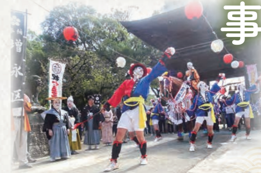
節頭行事(令和元年の増永地区)

風流と節頭行事は新型コロナウイルス感染症の影響で令和2～3年の奉納は休止しており、今年は3年ぶりの奉納となります。当日は新型コロナウイルスの感染症対策を行い実施するため、従来の奉納と少し異なる箇所があります。奉納当日に観覧する人は、奉納する人たちと十分な距離をとってください。