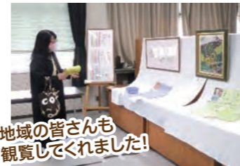
地域の皆さんも 観覧してくれました!