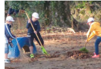
高学年の「朝のボランティア」やペア