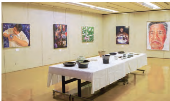
昨年度の展覧会の会場風景