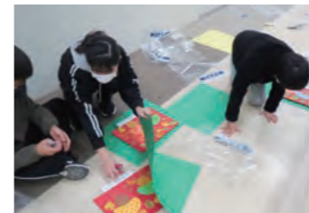
6年生が、会場づくりと片付けを手伝い、「みどりまつり」を盛り上げました。