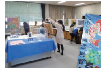
地域との協働活動として、地区協議会の資金援助のもと、5年生が企画・運営を行い、美術展覧会の「アール・ブリュット展」を開催しました。