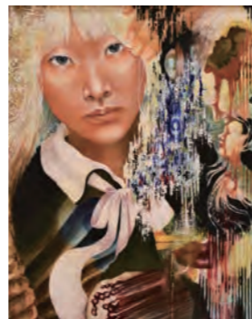
高校美術展最優秀賞作品

書道部は第20回全国書道展優秀賞、荒尾総合美術展秀作と結果を出しています。今後の岱志高校文化系部活動に要注目!