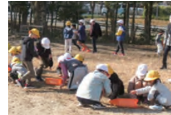
児童会活動の「一日一善運動」にみんなで取り組んでいます。