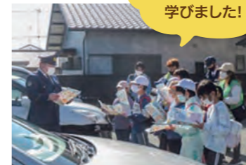
PTA主催「お仕事体験ウォーキング大会」は、夢や目標を持つきっかけにも。