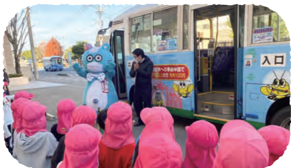
産交バスのマスコットキャラクター産太くんも登場し、教室は盛り上がりました。

コロナ禍で利用者数が減少している路線バスに乗車するきっかけづくりとして、産交バス株式会社と共同でバス乗り方教室を実施しました。園児約170人はバス乗降時の交通安全教育や、乗車マナーを学びました。実際に整理券を取って乗車体験を行った年長児は「初めて乗って楽しかった」、「また乗りたい」と楽しそうに話していました。