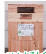
ご協力よろしくお願いします!

図書返却ボックスの利用についてのお願い あらおシティモール1階の外に設置している返却ボックスに図書館の蔵書以外のものがよく入っています。返却ボックスは、休館日でも図書の返却が出来るように設置しているので、市立図書館以外の本は入れないでください。