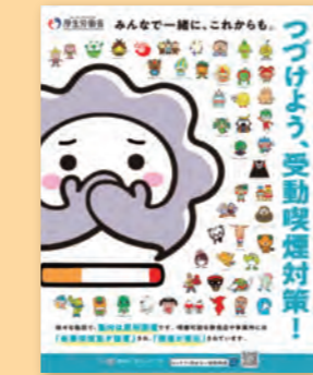
有明保健所 保健予防課 ☎72-2184