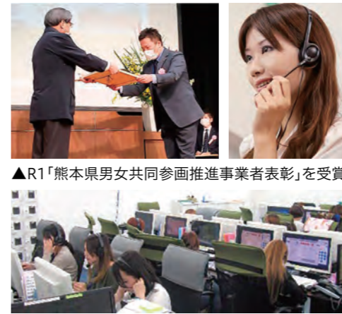
▲R1「熊本県男女共同参画推進事業者表彰」を受賞

この会社を選んだ理由は? 営業に興味があり、しゃべることも好きなので、声だけでお仕事をできるコールセンターに惹かれました。当社はインセンティブ制度でお給料もよく、ノルマもそんなに気にせず集中できるので、挑戦しようと思いました。 何をしている会社? 平成16年に鳥取県米子市に設立後、国内に5拠点を展開。コールセンター事業を主軸として5百人を超える体制でさまざまなニーズに対応しています。熊本・荒尾支店では「インバンドサービス」(商品の購入申込や各種問合せなどに対応)と「アウトバンドサービス」(新規顧客の開拓・潜在顧客の掘り起こしなど)に分かれ、1本の電話からビジネスチャンスを創出しています。