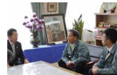
▲(株)コウ・テックの皆さん