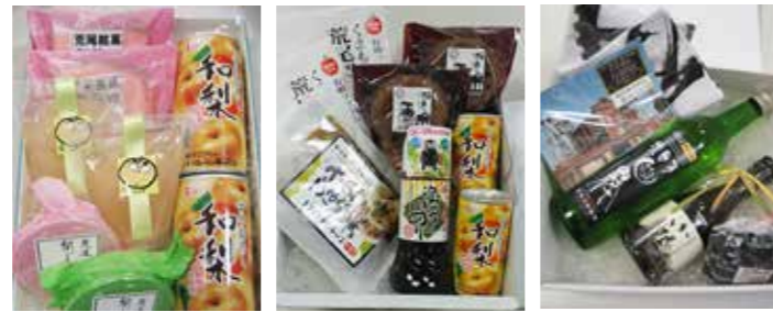
▲①梨の涼風セット A ▲②荒尾の恵みセット ▲③炭都の煌きセット