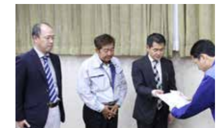
▲荒尾市建設業協会の皆さん