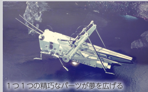
1つ1つの精巧なパーツが夢を広げる

加工に関する図面一枚一枚には、設計者の大切なメッセージが込められています。当社はその想いを実現するため、先進の加工設備を取り揃え、技術研さんに努めてきました。現代社会の身近な製品に携わっていることを誇りに、社内の知恵と技術を総動員して、これからも可能性を追求してまいります。