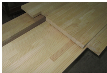
▲木のあらゆる部分をバランスよく使用するため品質にばらつきがない

天然の木を乾燥させてそのまま使用する無垢材に対し、集成材は強度や品質が安定していて、建材・造作材に多用される身近な存在。当社は主に家具や内装に使用される造作材を製造しています。一般的な集成した継ぎ目の製品だけでなく、厳選された木目のスライス(突き板)を表面に張った無垢のような製品も多く供給しています。