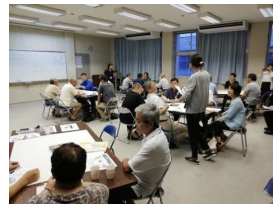
【井手川地区の参加状況】