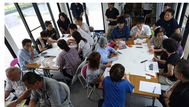
【万田中央地区の参加状況】

【万田中央地区】 日時：8月24日（土） 10時～ 場所：万田中央地区ふれあいハウス 参加者数：21名