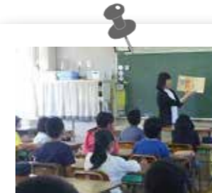
土曜授業の日の読み聞かせボランティア