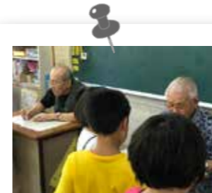
毎週木曜日のまる付けボランティア

「地域とともにある学校」として、地域と協働した活動を進めていくことで、地域に愛着を持ち、地域に貢献できる子どもたちを育てていきます。子どもたちの自主性を育て、自己肯定感を高めていき、みんなのキラキラ笑顔いっぱい学校を目指しています。